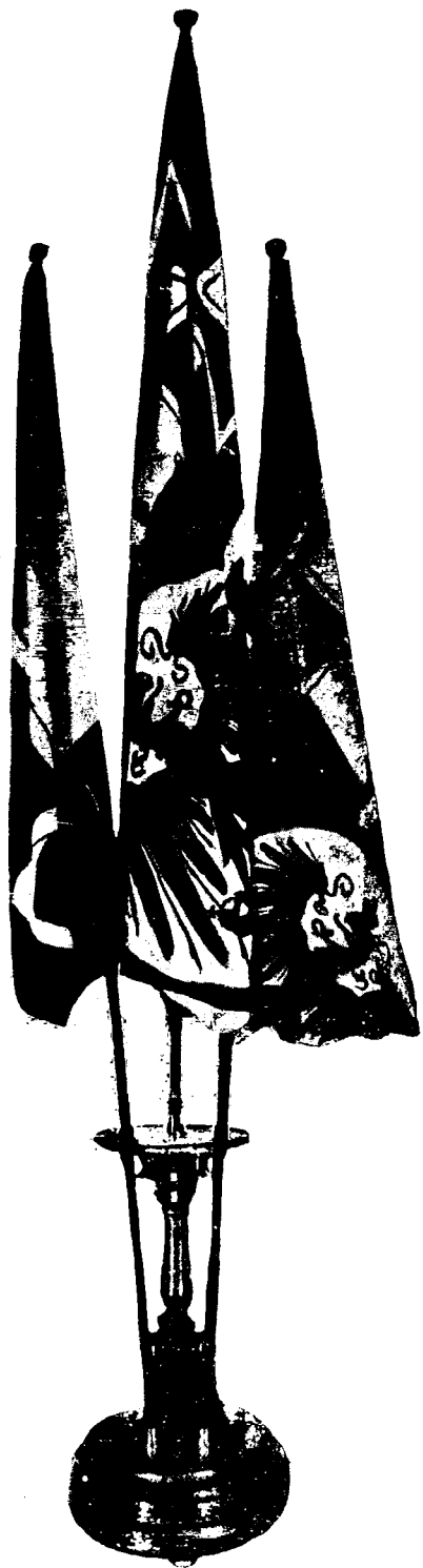
Реликвиі германскаго крейсера «Магдебургъ». Кормовой и стеньговый флаги и гюйсъ.