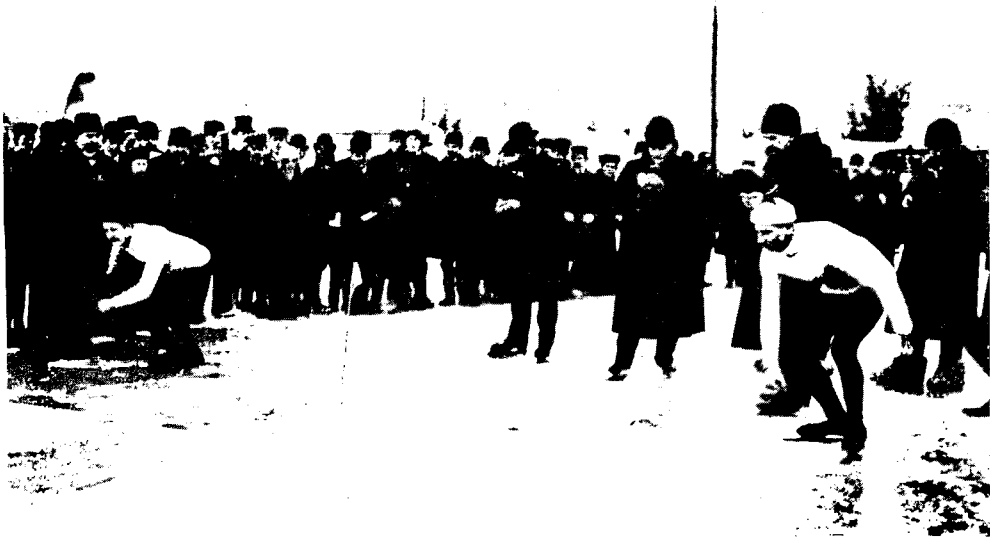
ШВЕЦІЯ. Состязанія въ бѣгѣ на конькахъ на скорость; стартъ.